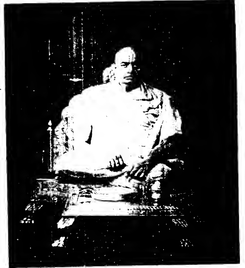
गोस्वामी १००८ श्रीगोकुलनाथजी महाराज

स्टूडियो बहार, २३-ए, सेन्ट्रल चौपाटी बिल्डिंग, चौपाटी, बम्बई-४०० ००७.